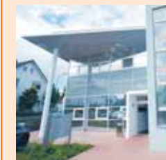
PHV-Dialysezentrum und Gemeinschaftspraxis

Lukas-Krankenhaus Hindenburgstraße 56 32257 Bünde Tel. 05223-167-0 Fax 05223-167-192 E-Mail info@lukas-krankenhaus.de www.lukas-krankenhaus.de