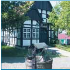
Kreisheimatmuseum Striediecks Hof Bünde

■ Die PHV bietet allen Dialysepatienten, die einen Aufenthalt in Bünde planen, die Möglichkeit der Ferendialyse. Inmitten der Ravensberger Mulde liegt die