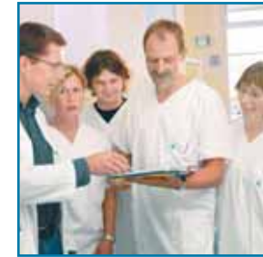
Vernetzung von ambulanter und stationärer Versorgung

■ Mit dem Lukas-Krankenhaus Bünde , auf dessen Gelände sich das PHV-Dialysezentrum befindet, besteht eine enge Kooperation. Die ärztlichen Leiter des