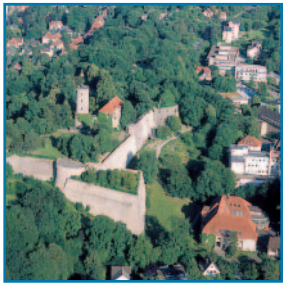
Bielefeld mit seiner historischen Sparrenburg

■ Die PHV bietet allen Dialysepatienten, die in Bielefeld zu Gast sind oder im Teutoburger Wald Urlaub machen, die Möglichkeit der Ferendialyse. Als kulturelles und wirtschaftliches Zentrum verbindet die Stadt die Vorzüge einer Großstadt mit (ent)spannenden Freizeitmöglichkeiten im Teutoburger Wald. In einer unverwechselbaren Mittelgebirgslandschaft gelegen, bietet sie dem Erholungssuchenden interessante Entspannungs-, Sport- und Freizeitmöglichkeiten. Für den kulturell Interessierten bieten zwei Theater, elf Museen mit interessanten Sonderausstellungen sowie internationale Konzert- und Kulturveranstaltungen ein abwechslungsreiches Programm während des ganzen Jahres.