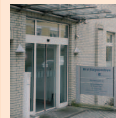
PHV-Dialysezentrum Kantensiek 25

Evangelisches Krankenhaus Bielefeld GmbH Kantensiek 19 33617 Bielefeld Tel. 0521-77 27 00 E-Mail info@evkb.de www.evkb.de Kontakt Nephrologische Abteilung EvKB-Gilead, Nephrologischer Bereitschaftsdienst (24 Std.) Tel. 0521-77 27 70 00