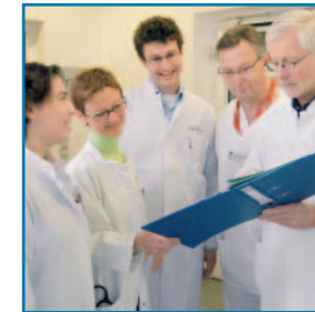
Vernetzung von ambulanter und stationärer Versorgung

■ Das PHV-Dialysezentrum liegt in Bethel in unmittelbarer Nachbarschaft zum Evangelischen Krankenhaus Bielefeld-Gilead. Seit Jahrzehnten besteht eine erfolg-