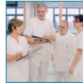
Vernetzung von ambulanter und stationärer Versorgung

■ Die ärztlichen Leiter des PHV-Dialysezentrums arbeiten mit den niedergelassenen Hausärzten und Fachärzten aus der Region sowie mit den Fachabtei-