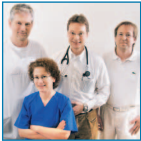
Das Leitungsteam des PHV-Dialysezentrums

■ Das PHV-Dialysezentrum Petershagen-Lahde bietet alle Formen der Hämodialyse an. Als ausgelagerte Behandlungsstätte des Dialysezentrums in Minden wird es