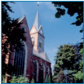
Klosterkirche im schönen Stadtteil Lahde

■ Die PHV bietet allen Dialysepatienten, die einen Aufenthalt in Petershagen-Lahde planen, die Möglichkeit der Ferendialyse. Die Stadt, an der Weser gelegen,