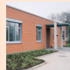
Das PHV-Dialysezentrum Petershagen

Klinikum I Friedrichstraße 17 32427 Minden Tel. 0571-801-0 Fax 0571-801-2001 E-Mail info@klinikum-minden.de www.klinikum-minden.de