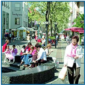
Mit Erholungswert: Die Singener Innenstadt

■ Die PHV bietet allen Dialysepatienten, die einen Aufenthalt in Singen planen, die Möglichkeit der Ferendialyse. Die Kreisstadt Singen liegt inmitten einer weithin unberührten Landschaft. Sanfte Hügel und grüne Wiesen in unmittelbarer Nähe zum Bodensee machen den Hegau zum idealen Ferienparadies. Kunst und Kultur haben in Singen einen hohen Stellenwert: