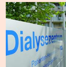
Das PHV-Dialysezentrum Singen

Hegau-Bodensee-Klinikum Singen GmbH Virchowstraße 10 78224 Singen Tel. 07731-89-0 Fax 07731-89-15 05 E-Mail info@hbh-kliniken.de www.hbh-kliniken.de