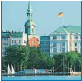
Die Alster lädt zu Bootsfahrten und Spaziergängen am Ufer ein.

■ Die PHV bietet allen Dialysepatienten, die einen Aufenthalt in Hamburg planen, die Möglichkeit der Ferientdialyse. Im Hamburger Hafen und an der Elbe