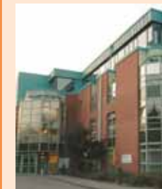
PHV-Dialysezentrum und Gemeinschaftspraxis

Asklepios Klinikum Nord/ Campus Ochsenzoll Langenhorner Chaussee 560 22419 Hamburg