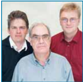
Die ärztlichen Leiter des PHV-Dialysezentrums

■ Das PHV-Dialysezentrum bietet nierenkranken Patienten sämtliche Dialyseverfahren einschließlich der Dialysebehandlung zu Hause an. Die ärztlichen Leiter