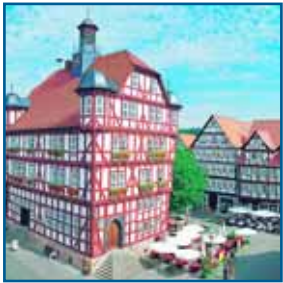
Romantischer Luftkurort mit historischen Fachwerkhauusern

■ Die PHV bietet allen Dialysepatienten, die Urlaub in Melsungen machen, die Möglichkeit der Ferendialyse. Der romantische Luftkurort im Fuldata ladt mit seinen