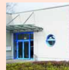
Das PHV-Dialysezentrum Melsungen

Klinikum Melsungen Kasseler Straße 80 34212 Melsungen Tel. 05661-777-0 Fax 05661-77 74 44 E-Mail melsungen@asklepios.com