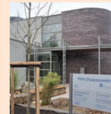
Das PHV-Dialysezentrum Herford

Dialysepflichtige Patienten werden wohnortnah in den PHV-Dialysezentren Herford und Bünde versorgt.