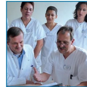
Vernetzung von ambulanter und stationärer Versorgung

■ Mit dem Klinikum Herford , auf dessen Gelände sich das PHV-Dialysezentrum befindet, besteht eine enge Kooperation. Die ärztlichen Leiter des PHV-Dialysezentrums arbeiten im Klinikum sehr eng mit den Fachabteilungen zusammen. Bei stationären Aufenthalten werden die Dialysepatienten dort weiterhin von den Ärzten des PHV-Zentrums versorgt.