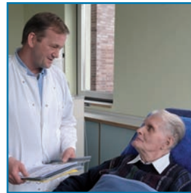
Individuelle internistische Diagnostik und Therapie

■ Die ärztlichen Leiter betreiben in direkter Anbindung an das Dialysezentrum eine nephrologische Gemeinschaftspraxis. Die Praxis ist auf die Behandlung von Patienten mit Nieren- und Bluthochdruckerkrankungen spezialisiert. Dabei ist es das wichtigste Ziel der Fachärzte, Begleiterkrankungen vorzubeugen und die Dialyse zu verhindern beziehungsweise hinauszuzögern. Dialysepflichtige Patienten erhalten eine individuelle Nierenersatztherapie und werden wohnortnah in den PHV-Dialysezentren Herford und Bünde versorgt. Die Fachärzte beraten in Fragen der Nierentransplantation, übernehmen die Anmeldung und gewährleisten eine kompetente Nachsorge.