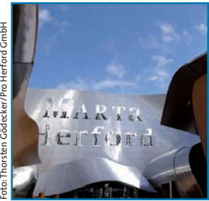
Einen Besuch wert: die MARTa in Herford

■ Die PHV bietet allen Dialysepatienten, die einen Aufenthalt in Herford planen, die Möglichkeit der Ferendialyse. 2005 machte die Stadt mit dem Projekt