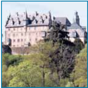
Schloss Eisenbach in Lauterbach

■ Die PHV bietet allen Dialysepatienten, die einen Aufenthalt in Lauterbach planen, die Möglichkeit der Ferendialyse. Lauterbach ist Kreisstadt des Vogels-