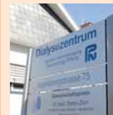
Das PHV-Dialysezentrum Lauterbach

Kreiskrankenhaus des Vogelsbergkreises in Alsfeld GmbH Schwabenröder Straße 81 36304 Alsfeld Tel. 06631-98-0 E-Mail info@kreiskrankenhaus-alsfeld.de www.kreiskrankenhaus-alsfeld.de