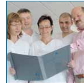
Vernetzung von ambulanter und stationärer Versorgung

■ Die ärztlichen Leiter des PHV-Dialysezentrums arbeiten mit den Fachabteilungen der umliegenden Kliniken zusammen. Eine enge Kooperation besteht