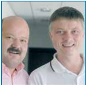
Die ärztlichen Leiter des PHV-Dialysezentrums

■ Das PHV-Dialysezentrum bietet nierenkranken Patienten sämtliche Dialyseverfahren einschließlich der Dialysebehandlung zu Hause an. Die ärztlichen Leiter