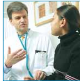
Spezielle internistische Diagnostik und Therapie