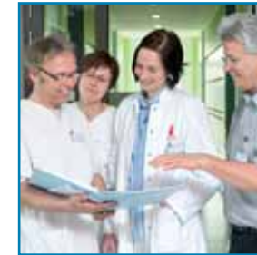
Vernetzung von ambulanter und stationärer Versorgung