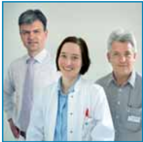
Das Ärzteteam des PHV-Institutes Hildesheim