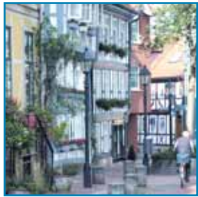
Hildesheim Altstadt: liebevoll restaurierte Fachwerkhäuser

Die PHV bietet allen Dialysepatienten, die in Hildesheim Urlaub machen, die Möglichkeit der Ferendialyse. Besonders berühmt ist Hildesheim für seine Kirchen und Kulturdenkmäler. Der romanische Dom und die St. Michaeliskirche gehören seit 1985 zum Weltkulturerbe der UNESCO. Sie sind Meisterwerke kirchlicher Baukunst und weltbekannt. Der historische Marktplatz mit dem berühmten Knochenhauer-Amtshaus wurde von Wilhelm von Humboldt einst als „der schönste Marktplatz der Welt“ bezeichnet. Die Hildesheimer Museen beherbergen kunstgeschichtliche Kostbarkeiten. Auch das Umland der Stadt bietet viele Möglichkeiten für eine attraktive Freizeitgestaltung.