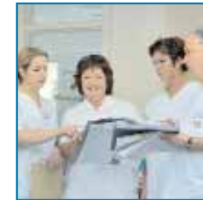
Vernetzung von ambulanter und stationärer Versorgung

■ Die ärztlichen Leiter des PHV-Dialysezentrums arbeiten mit den Fachabteilungen der umliegenden Kliniken zusammen. Eine enge Kooperation besteht mit