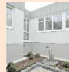
Das PHV-Dialysezentrum Marburg

Universitätsklinikum Gießen und Marburg GmbH Standort Marburg Baldingerstraße 35033 Marburg