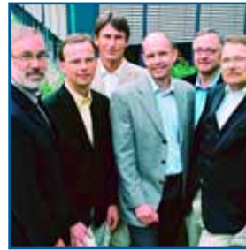
Die ärztlichen Leiter der PHV-Dialysezentren

■ Die internistische Gemeinschaftspraxis mit Sitz in Stuttgart-Mitte ist spezialisiert auf die Diagnostik und Behandlung von Nieren- und Bluthochdruck-