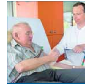
Individuelle Betreuung: im Zentrum oder zu Hause

■ Das PHV-Dialysezentrum Stuttgart-Mitte bietet nierenkranken Patienten, die aus medizinischer Sicht dafür geeignet sind, auch die Möglichkeit der Dialyse-