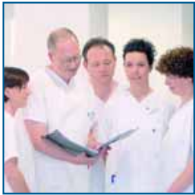
Das Pflegeleitungsteam sorgt für beste Patientenbetreuung

■ Die PHV-Dialysezentren in Stuttgart-Mitte, Dürrlwang, Bad Cannstatt und Feuerbach bieten sämtliche Dialyseverfahren an. Dialysepatienten werden von den