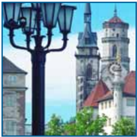
Die Stiftskirche in Stuttgart

■ Die PHV bietet allen Dialysepatienten, die im Raum Stuttgart Urlaub machen, die Möglichkeit der Feriedialyse. Die erlebnisreiche Metropole begeistert durch