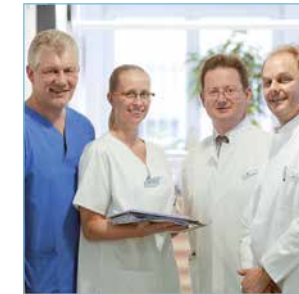
Vernetzung von ambulanter und stationärer Versorgung