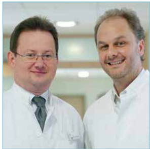
Das Ärzteteam des PHV-Dialysezentrums