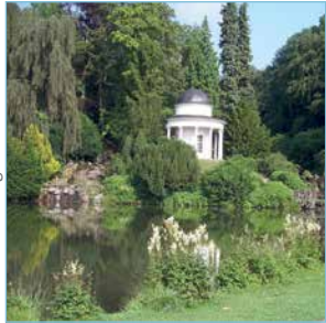
Apollotempel im idyllischen Bergpark Wilhelmshöhe

■ Die PHV bietet allen Dialysepatienten, die in Kassel Urlaub machen, die Möglichkeit der Ferendialyse. Die durch die documenta international bekannte