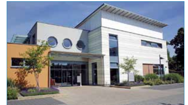
Das Nierenzentrum Oranienburg