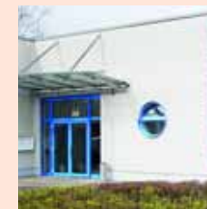
Das PHV-Dialysezentrum Melsungen

Klinikum Melsungen Kasseler Straße 80 34212 Melsungen Tel. 05661-777-0 Fax 05661-77 74 44 E-Mail melsungen@asklepios.com