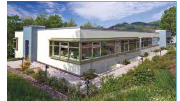
Das moderne Nieren- und Hochdruckzentrum in Bad Laasphe